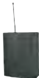
Junior DC 24v Junior DC 24V Junior DC 24V