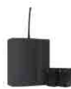
Junior DC 24v + BAT Junior DC 24V + BAT Junior DC 24V + BAT