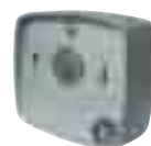
Selector P-5/2 P-5/2 Selector Sélecteur P-5/2