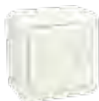
Botonera Abrir-Cerrar Open-Close keypad Boîtier de commande Ouvrir - Fermer